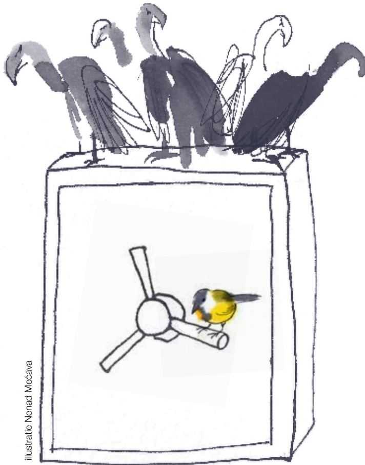
illustratie Nenad Mečava